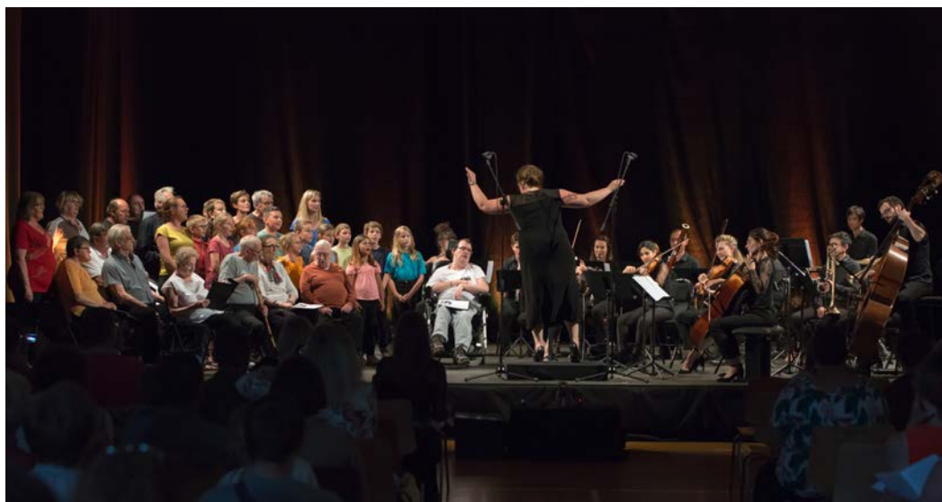
Des enfants et des usagers des structures partenaires de la Maison de l'Autonomie de l'Artois en première partie du concert de l'Orchestre des Concerts de Poche le 15 juin 2019 à Saint-Venant (62).