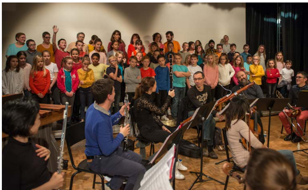
Des habitants de la Communauté de communes Flandre Lys en répétition générale avec l'Orchestre des Concerts de Poche le 9 décembre 2018 à Laventie (62)